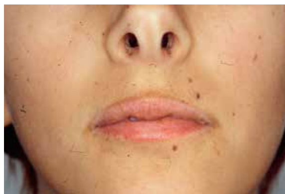
Ökad pigmentering i ansikte.

»Vid klinisk undersökning ses ofta lågt blodtryck och ökad gråbrun pigmentering, som syns särskilt tydligt på ärr, handflateveck och knogar samt i munslemhinnan.«