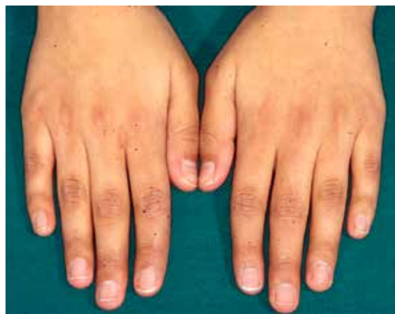
Ökad pigmentering på fingrar.