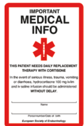
Varningskort för patienter med kortisolbrist.