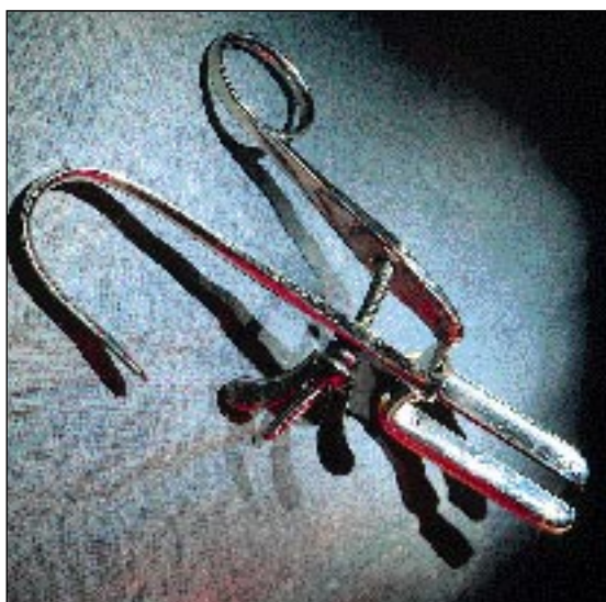
Hemorroidtången tillhörde operationsutrustningen vid Bjurholms sjukstuga. Den är tillverkad av stål och elfenben. Nu finns tången i de medicinhistoriska samlingarna vid Västerbottens museum i Umeå.