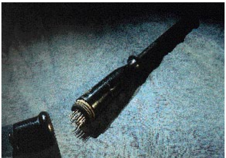
Hudsnäpparen från 1840-talet, från Köpenhamn, användes för att göra hål i epidermis. Vi har inget belegg för att den var i bruk vid smittkoppsvaccination (det mest

plausibla av de alternativ som gavs i tävlingen). Troligen användes den mest för att oljor och salvor (med t ex morfin eller belladonna) lättare skulle sugas upp av kroppen.