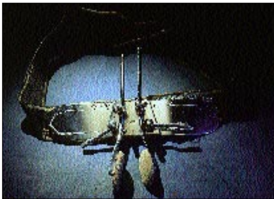
Näshållaren från Medicinhistoriska avdelningen vid Östergötlands länsmuseum ser ut som ett pinoredskap, men kom till användning vid näsfrakturer. Det svarta ripsbandet fästes runt skallen, och de sämskskinnsklädda näshållarna ställdes in med en nyckel. Konstruktionen kommer från Söderköpings lasarets röntgenavdelning. Troligen användes den på 1920-talet.