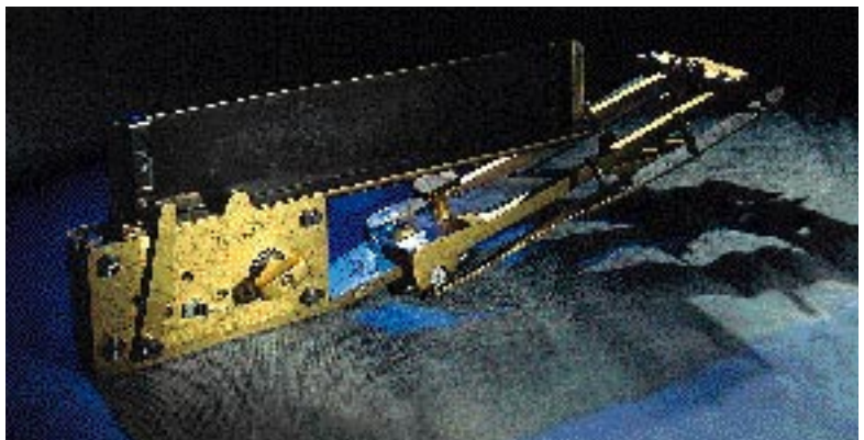
Sfygmografen , dvs en pulsräknare med grafisk registrering som gav en uppfattning om blodtrycket, kommer från det nyligen öppnade Medicinhistoriska museet i Uppsala. Modellen härstammar från 1800-talet. Den bands fast vid armen. Apparaten, som förvarades i ett svart fodral med texten »Sphygmographe de Marey», tillhörde fysiologiska institutionen i Uppsala.