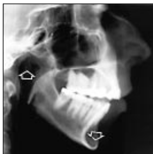
Figur 2. Patient som i vuxen ålder drabbats av RA. På två år har käkledsdestruktionerna skapat ramusförkortningar som gjort att bjetten roterat runt de bakersta tänderna och skapat ett frontalt öppet bbett.