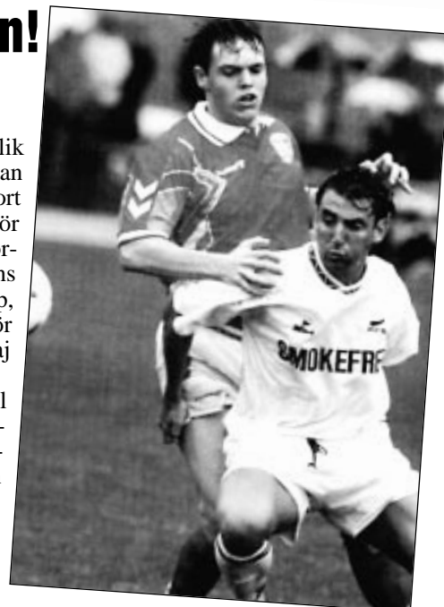
Ett rökfritt budskap från hälso-myndighet i Nya Zeeland via fotbollslaget.

spelen varit rökfria. I Göteborg arrangerades 1995 de första rökfria världsmästerskapen i friidrott. Det fanns vissa röktrutor, men för övrigt rådde rökförbud överallt. Tobaksreklam liksom försäljning av tobak var förbjudet inom arenaområdet. Apotek nära arenan hade öppet litet längre på kvällarna; där kunde man köpa tobakssubstitut i form av tuggummi och plåster.