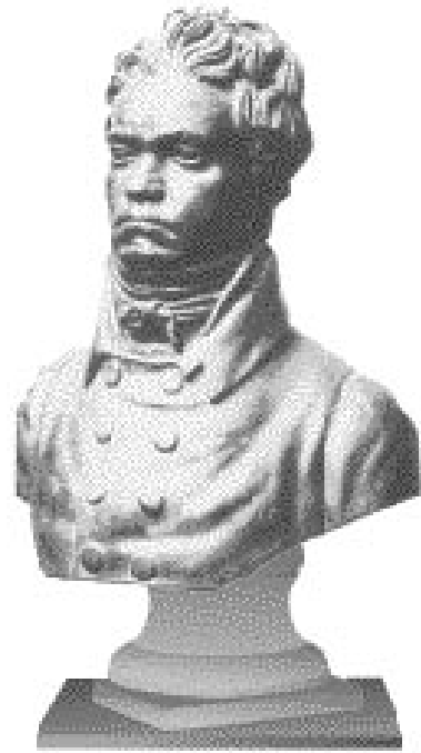
Figur 2b. Beethoven i 30-årsåldern, visande en kraftfull fysiologi.

danden. Hans bråk med slarviga kopister, tryckare och utgivare är välkända. Att döma av originalversionerna av Beethovens utskrifter, fulla av svårtydda rättelser och bearbetningar, torde emellertid producenterna inte haft ett lätt arbete.