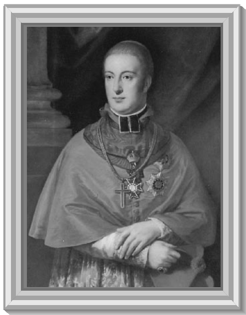
Figur 1. Ärkehertig Rudolf, Beethovens mecenat och hjälpare under lång tid. Tillägnades bland annat stråkkvartetten opus 133 »Grosse Fuge» med följande dedikation, där också hans maktställningar framgår.

Innan vi går in i sjukhistorien kan det vara intressant att veta något om Beethovens förhållande till kvinnor. Det står klart att han hade många förhållanden. Ofta förälskade han sig i vackra, kvinnliga elever, gärna av ädel börd. Men dessa förälskelser var inte sällan flyktiga. Undantag finns dock, och avancerade giftermålsplaner förekom vid flera tillfällen. Giftermål mellan en ädlings dotter och en musiker-komponist, om än känd, ansågs vanligtvis inte ståndsmässigt. Anonyma kvinnor tillägnades passionerade musikkompositioner och brev. De är dock inte säkert identifierade och har därför blivit föremål för många romantiska fantasier. Även om Beethoven var välkänd för sitt fruktansvärda humör, hade han likväl i personlighetsutrustningen en känslös, romantisk sida, vilket också naturligtvis framgår i hans kompositioner, till ex-