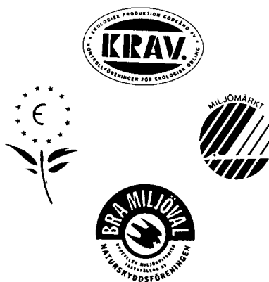
Kommer vi att finna någon av dessa märkningar på läkemedel i framtiden?

Var hittar man då idéer och inspiration till ett meningsfullt miljöarbete? Ett sätt kan vara att studera och ta del av