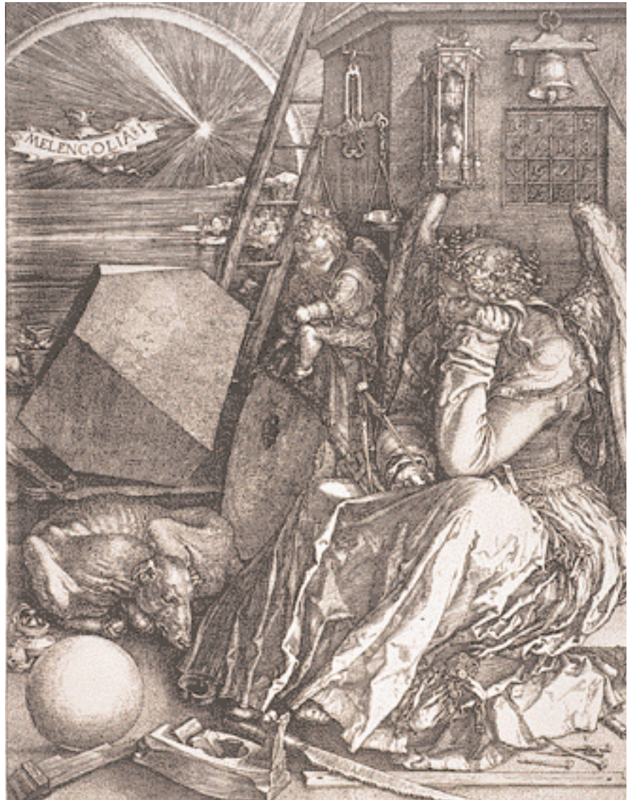
»Melencolia I«, kopparstick 1514 av Albrecht Dürer, avbildar en bevingad, »konstnärlig« melankoli, som har friggjort sig från den medicinska. Den hör till konsthistoriens mest omskrivna verk.

Begränsningen till fyra kroppsvätskor var en anpassning till ett ännu äldre tankemönster. Pytagoréerna, dvs lärjungarna till matematikern Pytagoras (580–500 f Kr), betraktade fyrtalet som den styrande principen. Så t ex styrdes mannen av (och i den ordningen) hjärna, hjärta, navel och fallos. Universum bestod av de fyra elementen jord, vatten, eld och luft, människolivet av ungdom (0–20 år), vuxenliv (20–40), deklination (40–60) och ålderdom (60–). Årstiderna