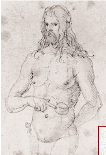
»Självporträtt med gul fläck« (t v) från ca 1512 tecknade Dürer inför en läkarkonsultation, där han pekar på sin mjälte – platsen för hans »mjältsjuka« eller melankoli.

Dürer har gjort andra verk där den avbildade personen lutar huvudet i handen – ett melankolins bildliga uttryck. Nedan t v ett självporträtt från ca 1491, t h den lidande Kristus, från ca 1494.