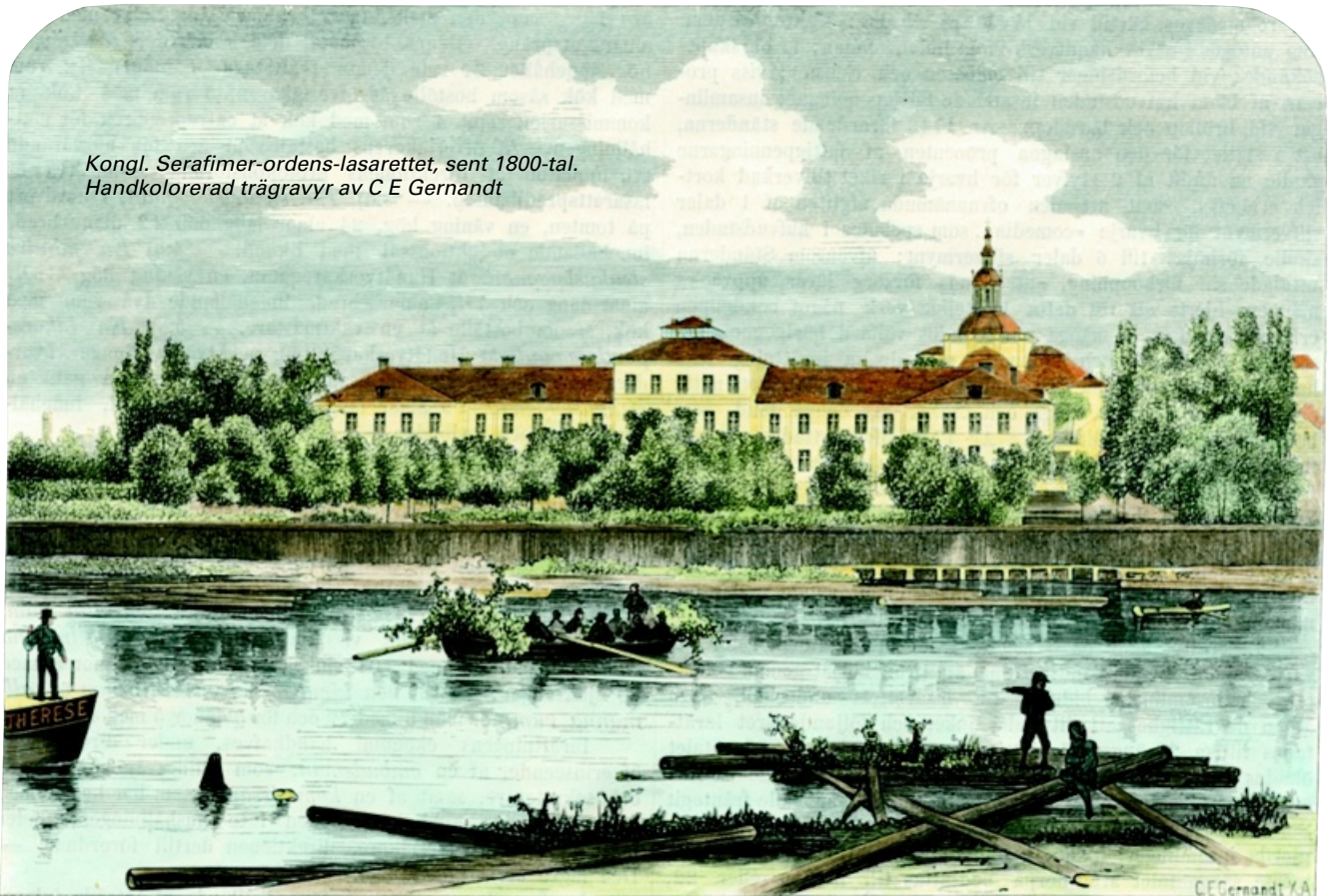
Kongl. Serafimer-ordens-lasarettet, sent 1800-tal. Handkolorerad trägravyr av C E Gernandt