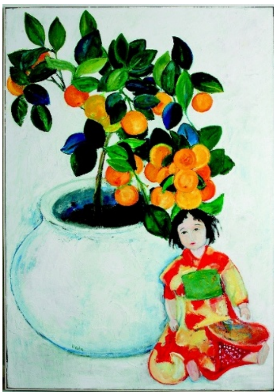
APELSINRÅDET OCH DOCKAN, en av de oljemålningar på duk som ingår i utställningen.