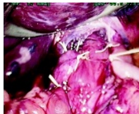
Efter operation, i detta fall hemifundoplicatur, Toupetplastik.

olika operationstekniker från 31 olika sjukhus påvisar inga markanta skillnader avseende olika teknikers effektivitet.