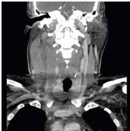
FALLBESKRIVNING Om Lemierres syndrom, som drabbar främst yngre. Sidan 403

167 hade svarat den 18 februari kl 11.00.