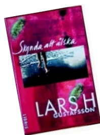
»SKYND A TT ÄLSKA« Bokförlaget Libris; 2001. ISBN 9789171954206.