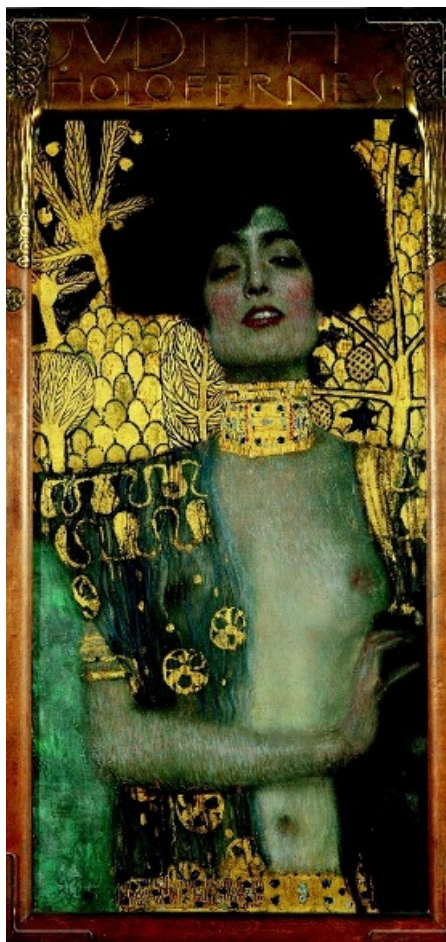
»JUDITH« Judith hållande den mördade Holofernes' avskurna huvud i sin hand.

I en medeltida kristen kontext har Danaë setts som en jungfrufödelsens förklaringsmall; kunde hon, så torde ju Jungfru Maria också ha kunnat bli gravid genom gudomligt ingripande. I en kristet symbolistisk tradition har Danaë setts som en personifikation av årbarheten och kammaren som skyddade hennes dygd som en bild av kyskheten. Boccaccio menar för sin del att det gyllene regnet symboliserar penningen som antingen förmått korrumpera Danaës dygd eller som vi-