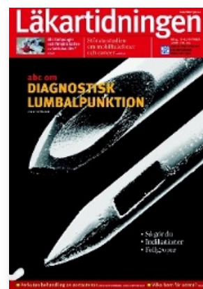
Läkartidningen nr 41/2008, där artiklen »ABC om diagnostisk lumbalpunktion« också var omslag.

Det är nämligen väl känt att den inledande antibiotikabehandlingen orsakar frisätt-