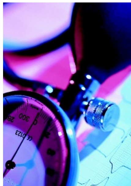
Modern blodtrycksmätning har hundraåriga anor.

Den tredje delen är betitlad »Ambulatorisk blodtrycksmätning« och skriven av Nyström. Här sammanfattas teknik och indikationer för ambulatorisk blod-