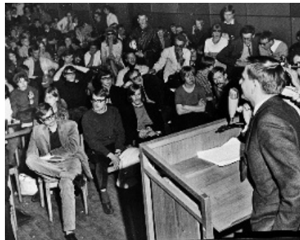
DEBATT Sinnebilderna av den antiintellektuella 68-rörelsen. Sidan 3752