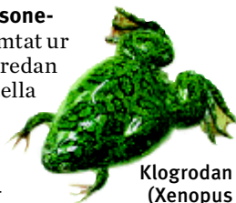
Klogrodan ( Xenopus laevis ).

är inte hämtat ur fantasin. Vi har redan djurexperimentella data som visar att vi är mycket nära denna fördjupade kunskap om primaternas (inklusive människans) befruktningsoögonblick. En art som tilldragit sig forskarnas intresse är den afrikanska klogrodan ( Xenopus laevis ). Där har man redan kunnat urskilja åtminstone tio olika faser inom vilka antalet subcellulära skeenden troligen är mångdubbelt större.