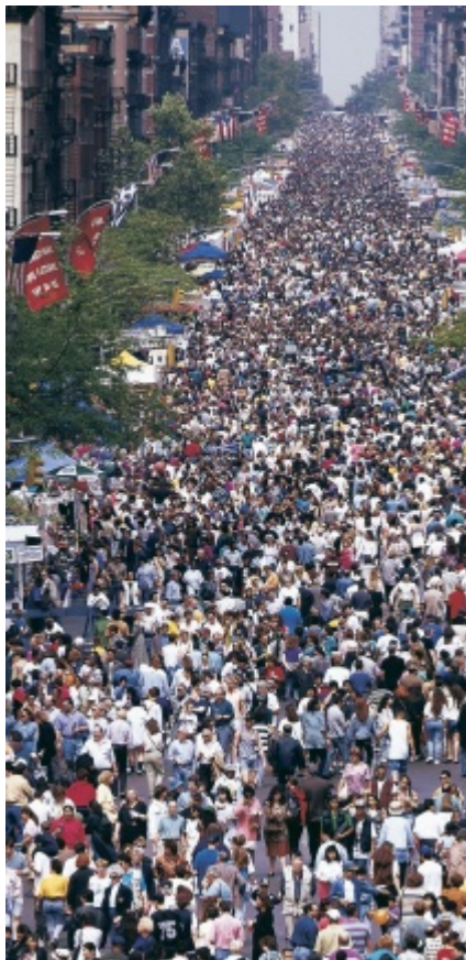
Ett stort antal amerikaner bär på HIV, och inom vissa riskgrupper i vissa städer är prevalensen mycket hög, i nivå med den i Sydafrika .

De två decennier som följde efter att HIV upptäcktes i början av 1980-talet präglades av snabba framsteg vad gäller screening av blod och förändrat beteende bland riskgrupper. Men upptäckten av antiviral terapi och snabb förbättring i tillgången till denna har, till skillnad mot vad många räknat med, inte minskat smittspridningen i den takt man hoppats. Statistik som belyser detta är antalet amerikaner som infekteras per