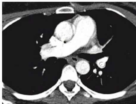
Figur 1. DTLA-teknik i det aktuella fallet (62 kg) enligt Tabell V: 500 mg I/kg, 97 ml, 320 mg I/ml, 6,1 mL/s, 100 kV/100 mAs eff . Täthet/brus/CNR i a pulmonalis för färsk 70 HU emboli = 355 HU/24 HU/12. DLP = 106 mGycm* *0,017 = 1,8 mSv.

Både DTLA och perfusionsskintigrafi ger lägre stråldoser till fostret (Tabell III) än genomsnittlig naturlig bakgrundsbe-strålning inklusive radon (1–2,5 mGy) under graviditeten [27]. Avståndet mellan strålfält och foster vid DTLA resulterar i allmänhet i lägre fosterdos under 1:a och 2:a trimestern än per-fusionsskintigrafi (Tabell III). Under 3:e trimestern kan DTLA ge fosterdos i samma magnitud som vid perfusionsskintigrafi om undersökningstekniken inte optimeras. Orimligt höga exponeringsparametrar vid DTLA (140 kV, 220 effektiv mAs) kan ge fosterdos på 0,65 mGy redan under 1:a och 2:a trimestern [28], medan ett optimerat skannprotokoll (100 kV/100 effektiv mAs) [23, 24] gav endast 0,06 mGy till ett fullgånget fosterfan-tom [29]. Bidraget från sekundärstrålningen kan reduceras med upp till 50 procent om moderns buk täcks med ett blyför-kläde och avståndet mellan det nedersta snittet och fostret maximeras [29, 30]. Under inga omständigheter ökar dosen till fostret när blytäckning används. Vi rekommenderar därför att moderns buk täcks cirkulärt med blyförkläde (0,7 mm) vid DTLA oavsett graviditetsålder [30]. Härmed skyddas också fostret mot oavsiktlig direktbestrålning. Topogram med poste-rior-anterior strålriktning, utförd kaudal-kranialt, minskar också bestrålningen av fostret. Risken för strålinducerad ospe-cificerad cancer hos ett barn efter in utero-bestrålning vid per-fusionsskintigrafi och DTLA sammanfattas i Tabell IV.