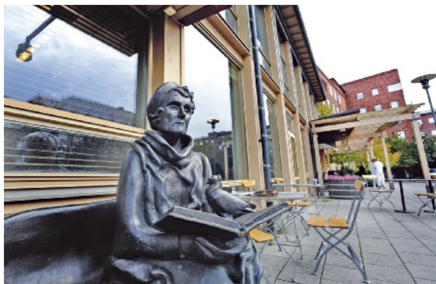
Astrid Lindgrens barnsjukhus behöver förbättra sina åtgärder kring smittspridning, visar en granskning av HSN.

– Men problemet är att man hade hittat dem redan när man gjorde den första analysen. Man hade till och med kört masspektroskopi i december, men man struntade i att redovisa dem. Pentobarbital har inte dödat flickan, Fenemal har inte dödat flickan, därför tog man