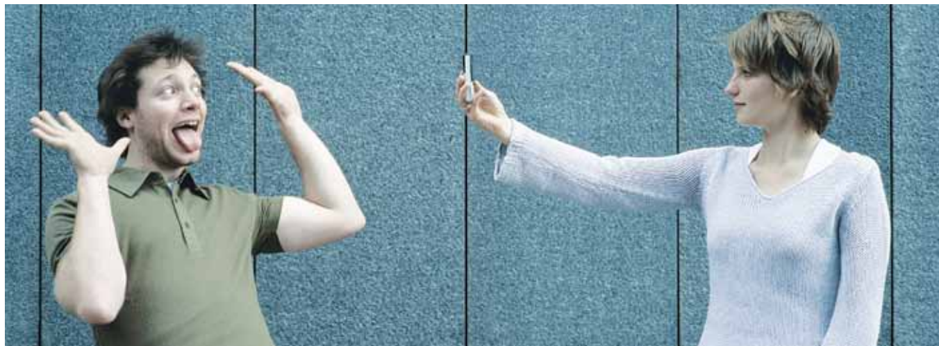
Kommunikation spelar – föga överraskande – en central roll i inlärningsprocesser.