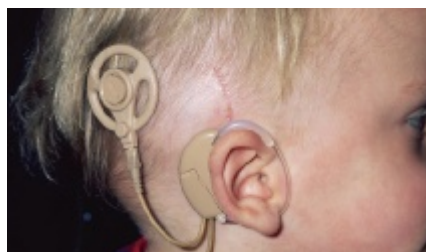
Implantat som opereras in före 18 månaders ålder gav bäst resultat.

Niparko JK, et al. JAMA. 2010;303(15):1498-506.