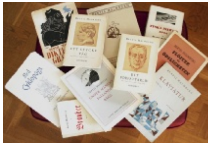
KULTUR Böcker av Bertil Malmberg. Sidan 1641