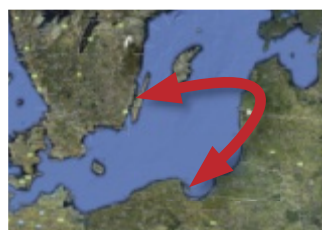
Medical University i Gdansk och Kalmar läns landsting knyter kontakt över Östersjön.

– Siktet är ställt på en långsiktig framtida läkarförsörjning. Landstinget har för det-