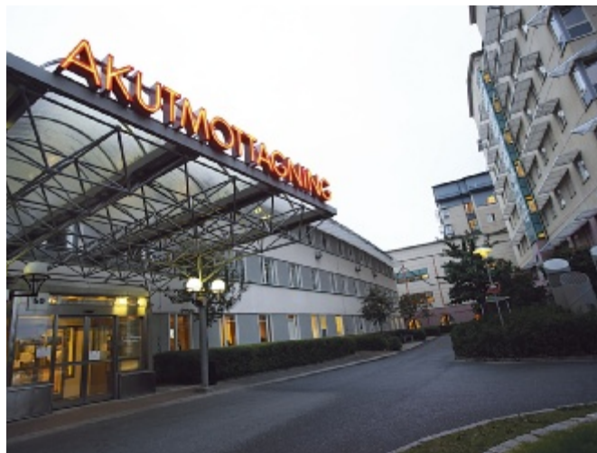
Nu stöder Arbetsmiljöverket akutläkarna på Akademiska sjukhuset i Uppsala.

För dessa krav vinner man dock inget gehör hos Arbetsmiljöverket. Myndigheten