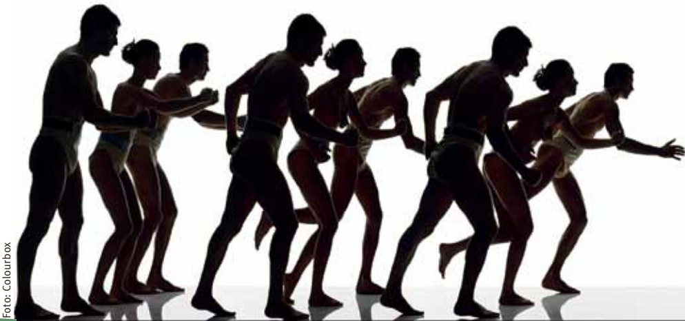
»Hälsa och psykologi«, som är uppföljaren till »Hälsopsykologi – en introduktion«, utreder begreppen sjukt och friskt och hur man bibehåller eller uppnår god hälsa.

Den vetenskapliga nivån är genomgående mycket hög. Varje kapitel kan läsas separat, och vissa delar behandlas så grundligt att de kan användas som introduktion till respektive ämne. Andra kapitel känns mindre genomarbetade, exempelvis bakgrunden till avsnittet om livsstil. Relevanta teorier presenteras, ibland tillsammans med resonemang som förmedlar kritik. Referenser-