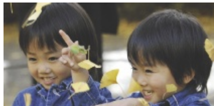
Dagens japanska flickor och pojkar förväntas leva i 85,7 respektive 78,9 år.

Institutet har nu utgivit ett 243-sidigt tidsskriftssupplement med 23 översiktsartiklar med tyngdpunkt på institutets forskning men ofta med ett tyd-