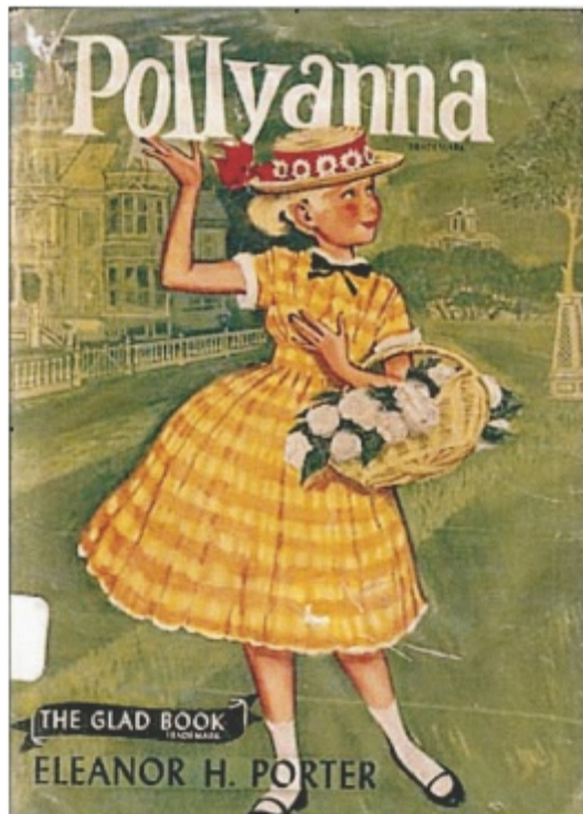
Figur 1. Benämningen Pollyanna-fenomenet kommer från en barnboks-serie om Pollyanna av Eleanor H Porter från början av 1900-talet och har beskrivits som »positivtetsbias« eller okritisk optimism.

Sökningarna på sinuit/otit och penicillin V gav 54 respektive 142 träffar, men endast två studier jämförde två- och tredosering av penicillin V [2, 3].