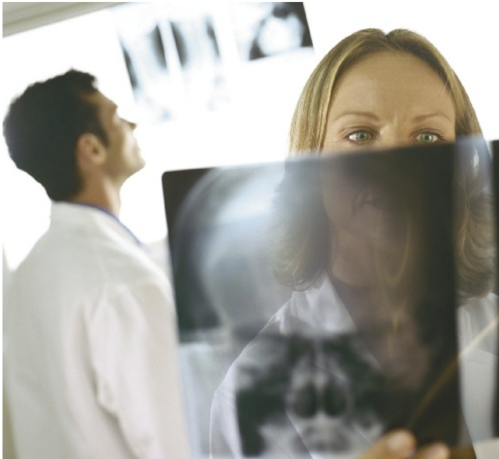
Kvinnliga verksamhetschefer arbetar kliniskt i snitt 20 procent, men många kvinnor avstår helt. Männen fortsätter dock att arbeta kliniskt i snitt 30 procent.

– Manliga chefer är inte lika övertygade om karriärstegets betydelse som kvinnliga, noterar »Chef i vården«. Kvinnliga verksamhetschefer arbetar kliniskt i snitt 20 procent, men många kvinnor avstår helt. Männen fortsätter dock att arbeta kliniskt i snitt 30 procent.