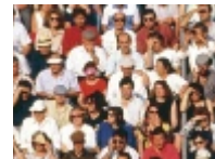
Stort socialt nätverk – stor amygdala.

det fanns en positiv korrelation mellan amygdalas volym och antalet sociala kontakter. Amygdalas volym var även positivt korrelerad med sociala kontakter från fler olika sociala grupper. Resultaten stod sig även efter att författarna justerat för ålder och »upplevd lycka« – det senare för att utesluta att det fanns en korrelation mellan amygdalas storlek och upplevd lycka och att det var på grund av denna som antalet vänner korrelerade med storleken på amygdala.