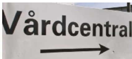
Praktik på vårdcentral ger goda förutsättningar att bedöma bl a studenternas lärande och prestationer.

Studenternas erfarenheter undersöktes i ett pilotprojekt med en portfolio, där frivilligt deltagande studenter skrev reflektioner över sitt lärande under praktiken. Ett viktigt tema var förbättrad struktur och effektivitet i patient-samtalet. Ett annat var patientcentrerad vård, som omfattade helhetssyn, förståelse av patientens sjukdomsperspektiv och vikten av att uppnå samförstånd. Ett tredje tema var studenternas professionella utveckling med ökad självkännedom, tankar kring attityder, klinisk resonemangsprocess, etiska problem och betydelsen av en god patientkommunikation.