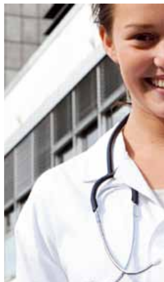
Studenterna står för den enskilt största ökningen av antalet medlemmar i förbundet.

Läkarförbundet har en uttalad målsättning att öka an-