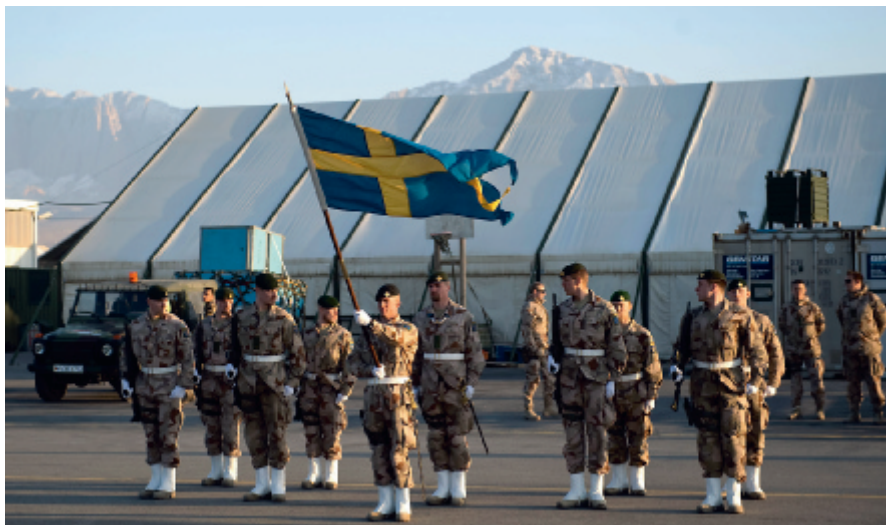
Foto: Henrik Montgomery/Scampix. Personerna på bilden har inget med artiklarna att göra.