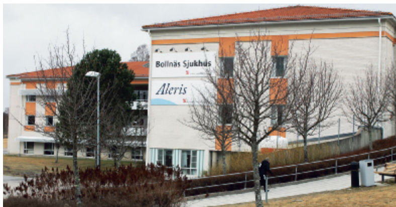
Aleris driver Bollnäs sjukhus sedan 1 april.

– Osäkerheten har gjort att sjukhuset dränerats på kompetens under det senaste årtiondet och inte minst på läkarsidan. Jag har själv haft funderingar på att lämna, men planerna på bolagisering har