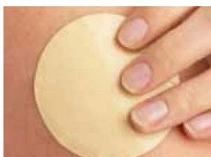
Få gravida i denna brittiska studie slutade röka med hjälp av nikotinplåster.

Primärt effektmått var andelen kvinnor som slutat röka vid barnets födsel, vilket undersöktes genom att halterna av kotinin mättes. Det innebär således att uppgift om rökstopp inte baserades på deltagarnas egen utsägo. Andelen som lyckats sluta röka visade sig vara