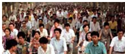
173 miljoner kineser riskerar fattigdom på grund av höga sjukvårdskostnader.

Detta innebär dock inte att hela sjukvårdskostnaden finansieras av samhället, det kan vara så att bara delar av kostnaden täcks. Dessa 1,28 miljarder kineser har dessutom inte nödvän-