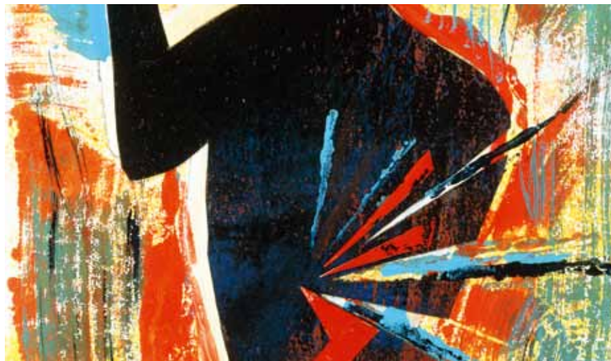
(bilden är beskuren)

En studie av hur ålder, kön och BMI korrelerar med smärtans ursprung vid ländryggsvärk kan hjälpa till att skapa rutiner för hur patienter bör utredas. NYA RÖN Sidan 1526