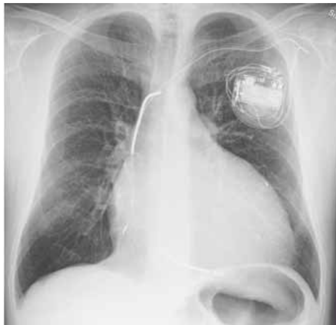
Röntgenbild av hjärta och lungor hos patient med uttalad hjärtsvikt. Patienten har en påtaglig kardiomegali, centralt vidgade lungkärl och en biventrikulär pacemaker med defibrillator (CRT-D [cardiac resynchronization therapy defibrillator]).

Med ekokardiografi och dopplermätning kan också den