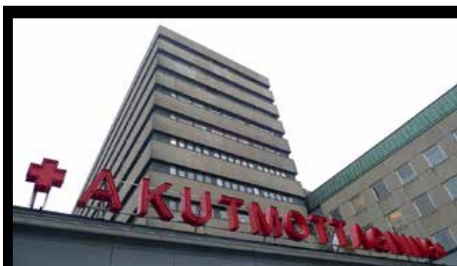
Akuten vid Skånes universitetssjukhus i Lund har problem.

– Det blir stopp i flödet eftersom patienter som är