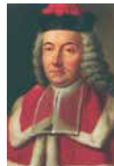
François de Sauvages