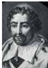
Joseph de Tournefort