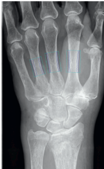
nya rön Handröntgen förutsåg hö - frakturrisk. Sidan 548