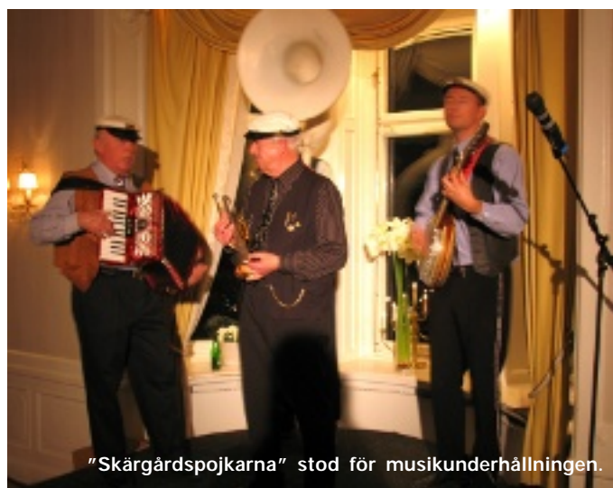
"Skärgårdspojkarna" stod för musikunderhållningen.