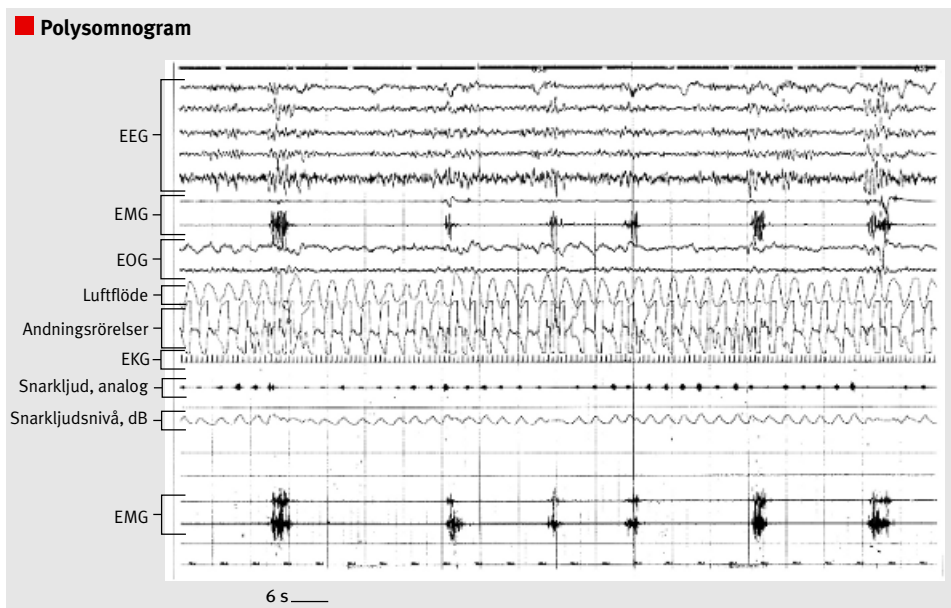
Figur 2. Polysomnografikurva från en patient med periodic limb movements under sömn. (EEG = elektroencefalogram, EMG = elektromyogram, EOG = elektrookulogram.)

frekventa nattliga uppvaknanden, ytlig sömn och kort total sömntid [11, 30] (Figur 1). De sensoriska symtomen, som på grund av den cirkadiska variationen är som värst kvällstid, interfererar med insomnandet, och det blir svårt att komma till ro. Under dåsighet och sömn har drygt 80 procent [31] dessutom en rytmisk motorisk aktivitet med muskelkontraktioner i de afficerade extremiteterna. De uppträder i tåg om minst 4 kontraktioner i rad med 5–90 sekunders intervall och en duration på 0,5–5 sekunder (periodic limb movements) [32, 33] (Figur 2). Oftast ses en strikt rytmicitet med 20–25 sekunders intervall mellan kontraktionerna, vilka kan vara av varierande intensitet – allt ifrån osynliga på ytan till kraftiga ryckningar eller sparkar som får vederbörande att trilla ur sängen.