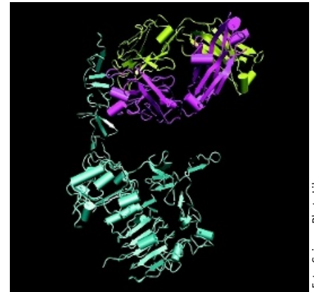
Molekylär modell av Herceptin, ett läkemedel som fått NEJM och Lancet att inta helt olika åsikter.

New England Journal of Medicine (NEJM) publicerade i oktober 2005 de tre studierna och en ledare om behandling av bröstcancer med trastuzumab. I den internationella HERA(Herceptin Adjuvant)-prövningen jämförs nära 1 700 kvinnor som får ett års tillägg av trastuzumab efter sedvanlig bröstcancerbehandling med nära 1 700 kvinnor som får sedvanlig bröstcancerbehandling. I de två amerikanska studierna jämförs även nära 1 700 patienter som får sedvanlig amerikansk behandling med nära 1 700 kvinnor som får samma behandling med tillägg av trastuzumab.