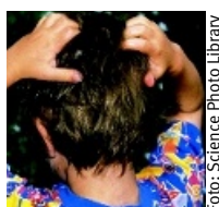
Resistens mot befintliga lusmedel är ett problem.

Pearlman DL. A simple treatment for head lice: dry-on, suffocation-based pediculicide. Pediatrics . 2004; 114:275-9.