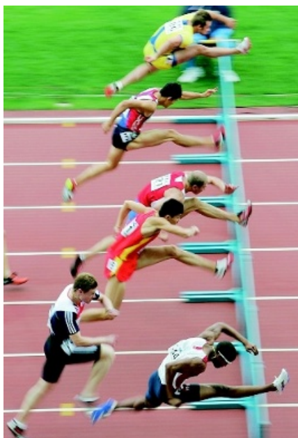
Dopningstest inom idrotten borde kombineras med genanalys. Denna svenska studie visar att asiatiska män kan ha oväntat låg koncentration av testosteron i urinen.

Samma slags skillnad observerades också för utsöndringen av en lång rad andra androgener. Huruvida UGT2B17