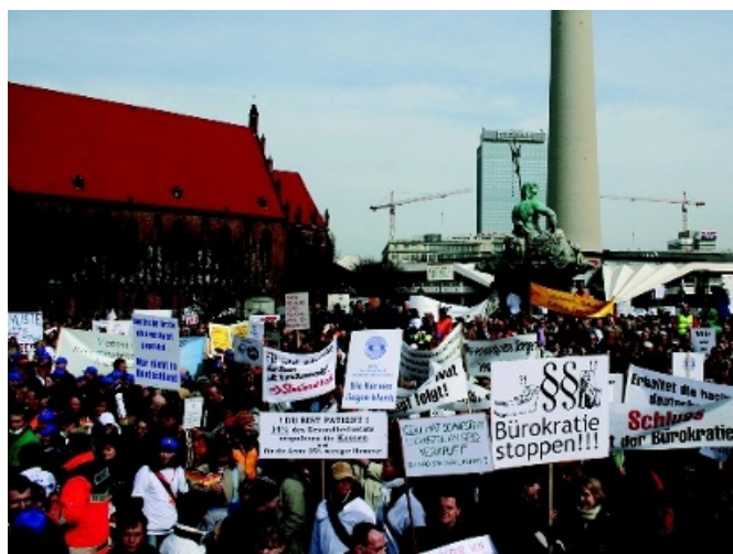
Demonstrerande läkare i Berlin.

Strejken inleddes egentligen förra året, men efter att avtalsförhandlingarna gått i stå valde man i mitten av mars att återigen börja strejka. För en dryg vecka sedan samlades 6 000 läkare i Hannover för att demonstrera. Iklädda vita rockar delade de ut information samt passade på att bjuda förbipasserande på gratis blodtryckskontroll. Förståelsen för strejken från allmänhetens och patienternas sida är störst vad gäller arbetsti-