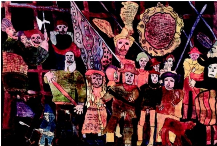
NATTVAKTEN. Den konstnärliga handen kan inte stå emot den ström av fantasifula tankar som dyker upp hos denna konstnärinna när hon målar. Ofta hjälper hon till att berätta sin historia med spegelvänd skrift i bilden.