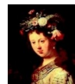
SASKIA SOM FLORA. Detta är ett i en serie porträtt målade efter den store hjälten Rembrandts porträttbilder. Piet heter konstnären som målar ansikten i glödande röda toner.

han. Det som förenar dem är de enkla, färgstarka ansiktena, som är mycket personligt tolkade – mer än någonsin Rembrandts – och som troligen speglar konstnärerna själva.