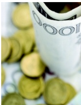
Inkomsteffekten försvann när man tog hänsyn till faktorer som ålder, diabetes, hypertoni etc.

Inkomst och socioekonomisk status har lyfts fram som viktiga faktorer vad gäller