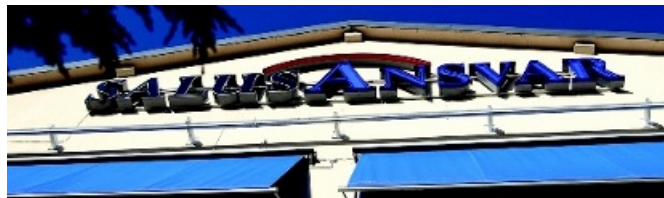
Salus Ansvar och det helägda livbolaget köpte gemensamt sakbolaget Ansvar, som sedan gick i konkurs.

Mest känt är Skandia, där försäljningen av kapitalförvaltningen ifrågasattes, liksom hur det gick till när Skandias livbolag köpte Skandias kontorsfastighet. För närvarande pågår det en process mellan Skandia och Skandia Liv. Spararna i Skandia Liv förbereder också en grupp-