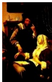
FRANS VAN MIERIS D Ä »The doctor's visit«, 1657.