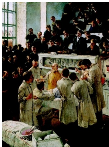
ADALBERT FRANZ SELIGMANN »Der Billroth'sche Hörsaal im Wiener Krankenhaus«, 1891. Theodor Billroth opererar. Där står han nästan som Gud fader i vit operationsrock, långt vitt skägg med ljuset fokuserat på hjässan. Ovan.

Empatisk eller inte, med vetenskapens stöd i ryggen och alltmer tydligt formaliserade läkarutbildningar steg läkarens status generellt från 1800-talet och framåt. Dessförinnan var folkets förtroende litet och stod ofta närmare folkmedicinen. Vid sekelskiftet fick läkaren samma upphöjda ställning i folks ögon som domaren, biskopen eller borgmästaren. Läkarna blev samtidigt den nya tidens hjältar, vilka skulle befria människor från okunskap och sjukdom [6]. Ändå lät de verkliga behandlingsmässiga framgångarna vänta på sig ända fram till 1930- och 40-talen med exempelvis penicillinets genombrott. I konsten vittnar en del satirer om de kvacksalvare som utnyttjade människornas behov av bot, men framgångsbilderna dominerar. Idéhistoriken Karin Johannissons texter