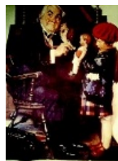
NORMAN ROCKWELL »Doctor and doll«, 1929.

serade på detta tema var Molière. En senare konstnär som vid skiftet mellan 1700- och 1800-tal gärna drev gäck med läkarna i bildform var Thomas Rowlandson. I t ex »The medical dispatch« förlöjligar han läkaren genom att förse honom med en korpulent kroppshydda och göra honom mer intresserad av egen vinning än patientens väl. Eftersom medicinens kurativa förmåga var ytterst begränsad öppnades ett utrymme för charlataner att slå mynt av människors lidande. Men förlöjligande av läkarna speglar också den ambivalens, för att inte säga hatkärlek, som allmänheten ofta haft till läkarkåren.