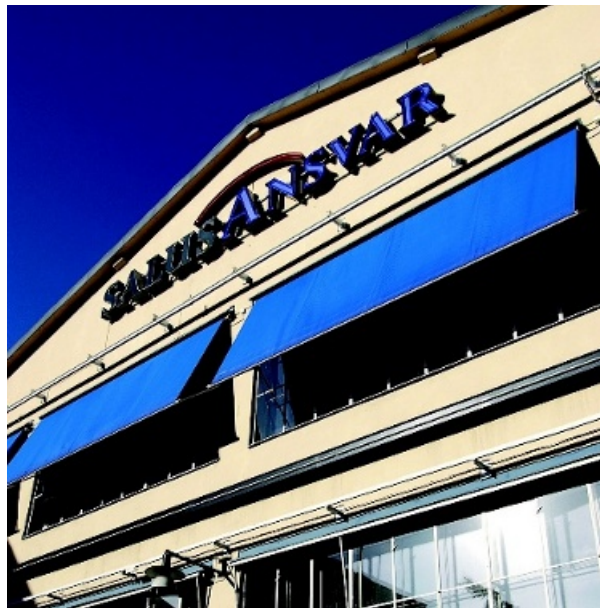
Salus Ansvar sa på sitt styrelsemöte nej till en intern utredning av bolaget.

Enligt Aktiebolagslagen kan en delägare som äger minst tio procent av aktierna i ett